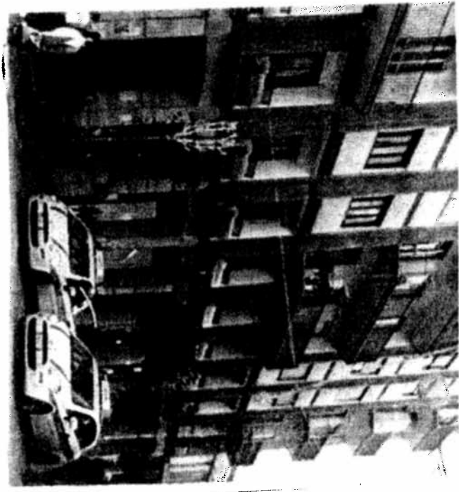
La sede del Consorzio di Bacino Salerno 2

Nonostante quest'episodio, alla fine si è riusciti ad ottenere un rinvio della discussione. Già nei prossimi giorni potrebbe finalmente esserci un nuovo incontro tra le parti. Sembrava che l'intenzione del Consorzio sia quella di far sottoporre il dipendente ad una nuova visita medica per stabilire le sue condizioni e, quindi, sostenere l'indoneità a svolgere quelle mansioni. Questa la tesi del Consorzio. Ma per l'Usb si tratterebbe dell'ennesima discriminazione sindacale